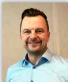
René Achenbach Grüne Hülle Fassadenbegrünung