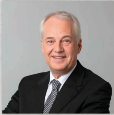
Michael Halstenberg Der 3. Finanzierungsweg des Bauherrn: Gibt es einen Schaden ohne Mangel?