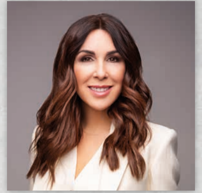
Judith Williams Von der Vision zur Marke - Judith Williams über ihren Weg nach oben